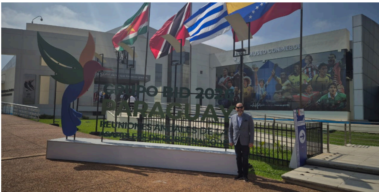
Temístocles Rosas Presidente del IGCP

El Instituto de Gobierno Corporativo de Panamá participó en la Asamblea de Gobernadores del Banco Interamericano de Desarrollo, celebrada en Paraguay, un espacio de alto nivel que reúne a líderes y autoridades para abordar temas clave del desarrollo económico y social de la región.