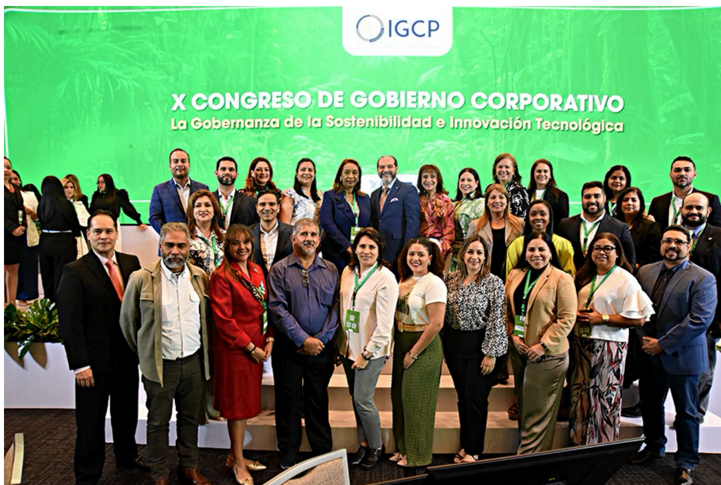
Delegación del Canal de Panamá en el Congreso IGCP

Esta decisión refleja su liderazgo institucional y su interés continuo en fortalecer estándares de transparencia, rendición de cuentas y sostenibilidad, alineados con las tendencias globales de gobierno corporativo. Para el Instituto, este paso representa un respaldo significativo por parte de una de las organizaciones más emblemáticas del país, consolidando la confianza en su misión de promover la excelencia en la gobernanza en Panamá y la región.