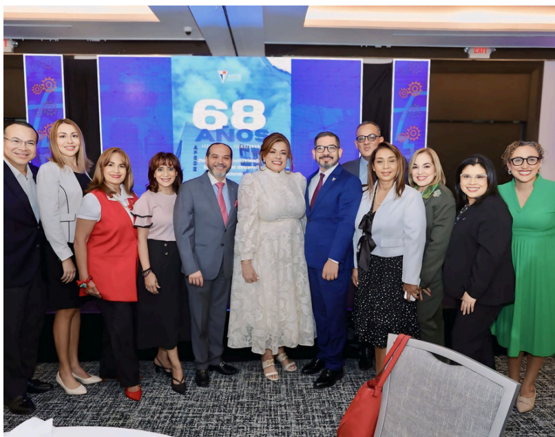
Miembros de la Junta Directiva IGCP y asociados