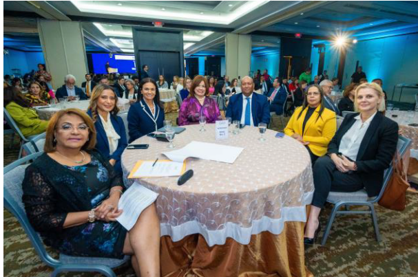
La presidente del IGCP – Marta Lasso junto a los expositores e invitados especiales.