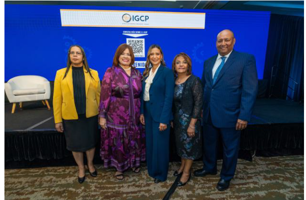
Con los miembros del panel sobre la Implementación de las NIIF.