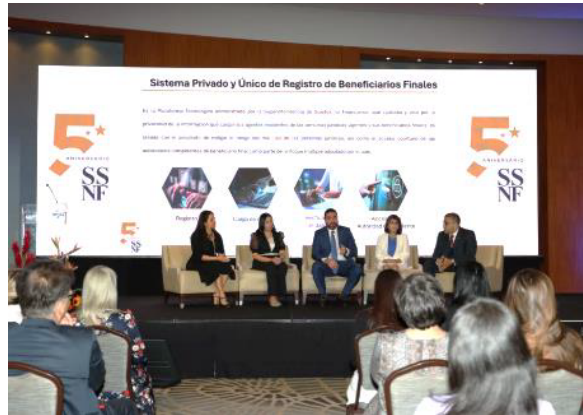
Este evento se realizó en el marco del V Aniversario de la SSNF.

El Instituto de Gobierno Corporativo Panamá (IGCP) participó en la rendición de cuentas de la Superintendencia de Sujetos No Financieros (SSNF), donde la superintendente Dayra Carrizo Castillero subrayó su compromiso de capacitar a los regulados en la mitigación de riesgos relacionados con el blanqueo de capitales. Entre los logros destacados por la superintendencia está el haber logrado la salida de Panamá de la lista GAFI, un hito importante en la lucha contra el lavado de dinero y financiamiento del terrorismo.