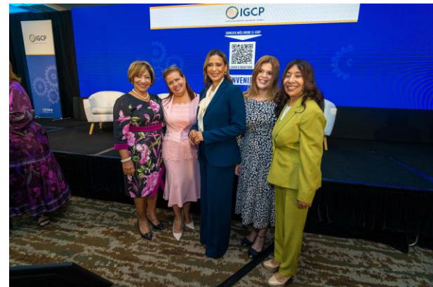
Comité de Auditoría y representantes de PwC Interaméricas.