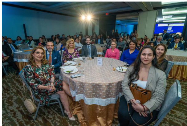
Miembros de la Junta Directiva del IGCP, asociados e invitados.