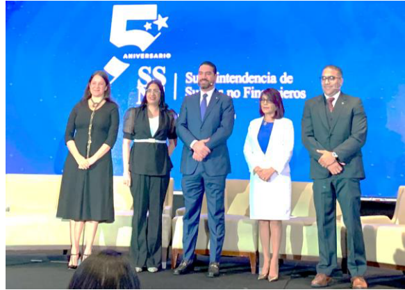
La superintendente junto a los directores que realizaron la rendición de cuentas.