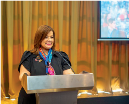
Marta Cristina Lasso Presidente IGCP

El Instituto de Gobierno Corporativo de Panamá (IGCP) y la Asociación de Secretarios Corporativos de Latinoamérica (ASCLA) agradecen a todos los participantes, patrocinadores y colaboradores por su contribución al éxito de este evento.