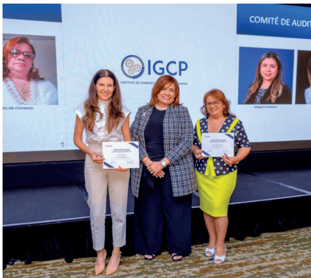
Comité de Auditoría