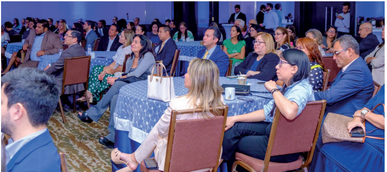
Asistentes al evento