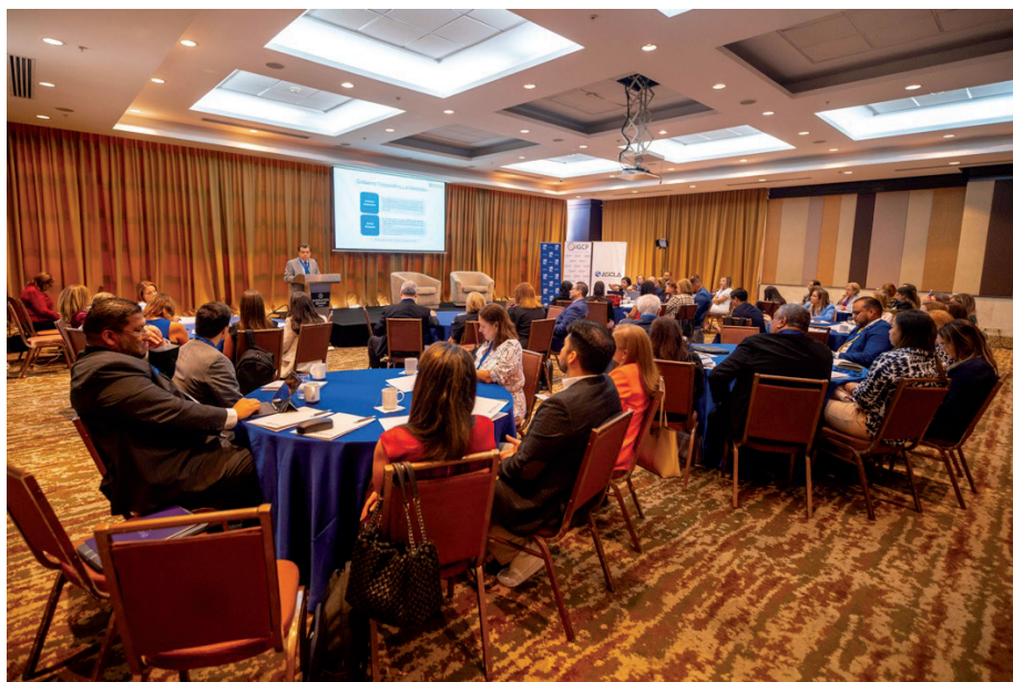
Participantes al evento