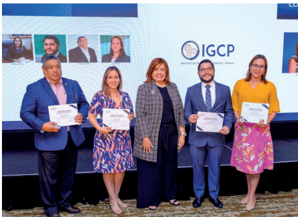
Comité de Afiliación y Relacionamiento con Afiliados

Entre los comités reconocidos se encuentran: